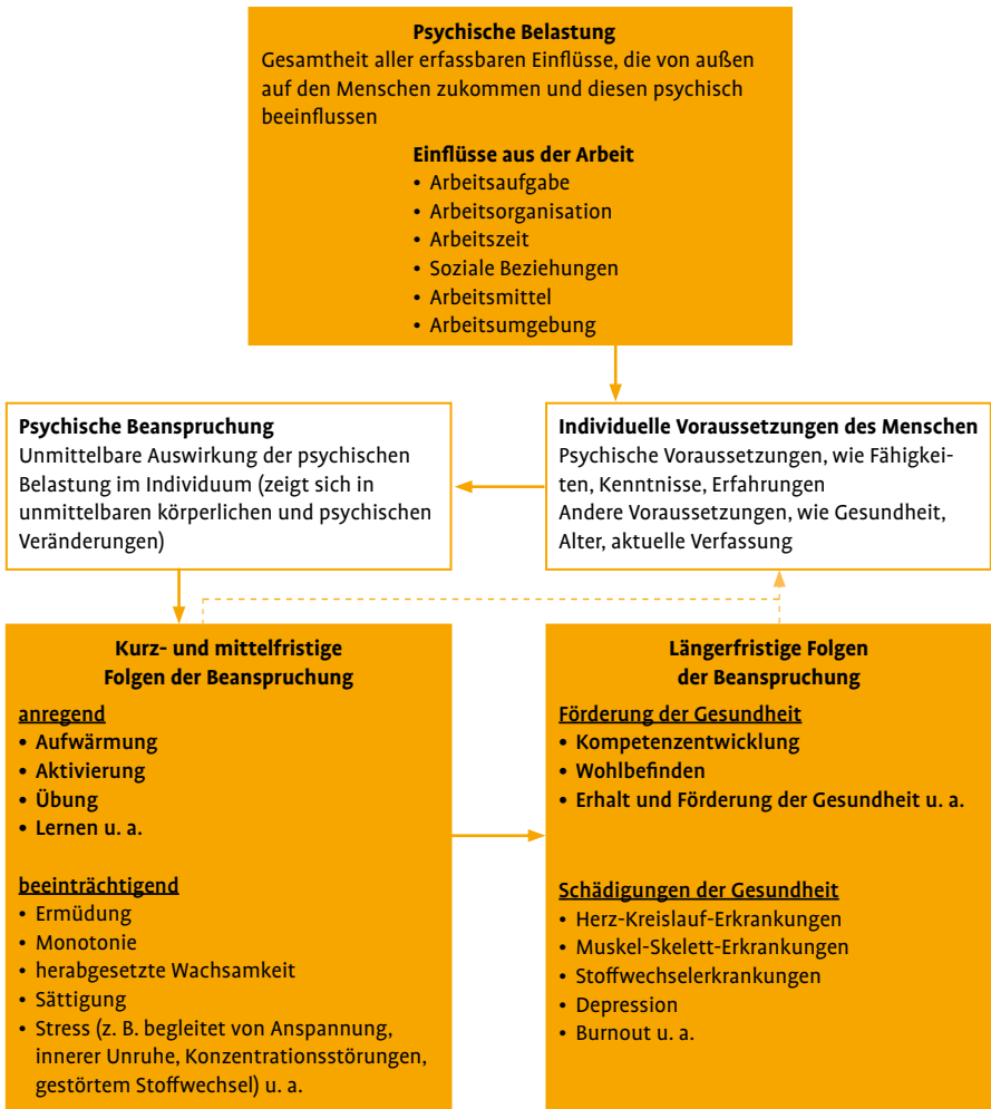
Abbildung 1: Psychische Belastung, Beanspruchung und Beanspruchungsfolgen